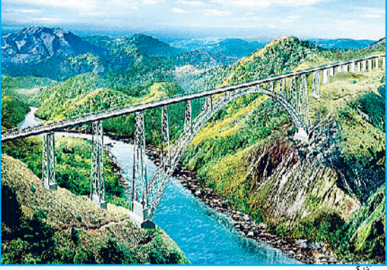
चिनाब पुल जम्मू-कश्मीर के रियासी में