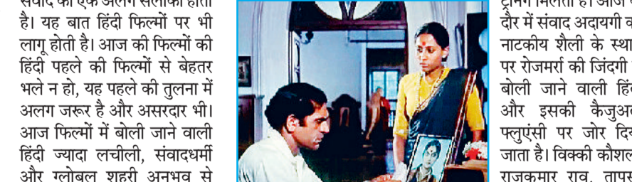
भाषा को साधने में माहिर थी स्मिता पाटिल

संवादों में लयात्मकता होती थी और इसमें कविताई का आभास होता था। समग्रता में देखा जाए तो पिछली सदी के 70 और 80 के दशक में अभिनेता हिंदी को एक खास छंद, उठराव और 'दबाव' के साथ बोलते थे। यह एक 'शास्त्रीय लहजा' था, जो दिलीप कुमार, अमिताभ बच्चन, शबाना आजमी, स्मिता पाटिल आदि कलाकारों की संवाद अदायगी में दिखता था। आज के फिल्मों की हिंदी: हर दौर की अपनी एक अलग भाषा, संवाद का एक अलग सलीका होता है। यह बात हिंदी फिल्मों पर भी लागू होती है। आज की फिल्मों की हिंदी पहले की फिल्मों से बेहतर भले न हो, यह पहले की तुलना में अलग जरूर है और असरदार भी। आज फिल्मों में बोली जाने वाली हिंदी ज्यादा लचीली, संवादधर्मी और ग्लोबल शहरी अनुभव से जुड़ी है। यह किसी खास उच्चारण और लहजे में नहीं बोली जाती बल्कि यह हमारे-आपके जैसे सामान्य लोगों की तरह ही बोली जाती है। हिंदी बोलने में दिखता है आत्मविश्वास: आज की पीढ़ी के अभिनेता और अभिनेत्रियां हिंदी को पूरे आत्मविश्वास से बोलते हैं। उदाहरण के तौर पर फिल्म 'सरदार' में बोली जाने वाली हिंदी की एक और खास बात यह है कि आज के ज्यादातर