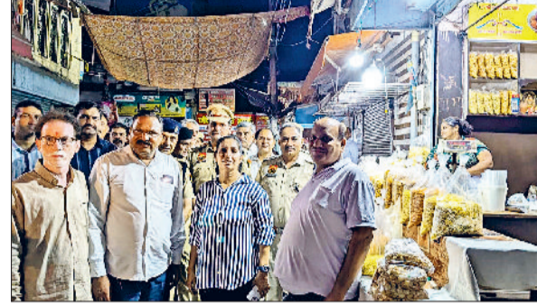
सोनीपत। फुट पेट्रोलिंग के दौरान पुलिस आयुक्त एवं अन्य अधिकारी।

बिचपड़ी से जागसी रोड स्थित रजवाहा की पुलिसिया पर किसी के इंतजार में बैठा है। पुलिस ने मौके पर पहुंचकर उसे काबू किया। उसके पास थैला मिला, जिसमें नशीला पदार्थ था। पुलिस ने उससे 3.124 किलोग्राम चरस व 428 ग्राम अफीम बरामद की। आरोपित के विरुद्ध सदर थाना में केस दर्ज किया गया।