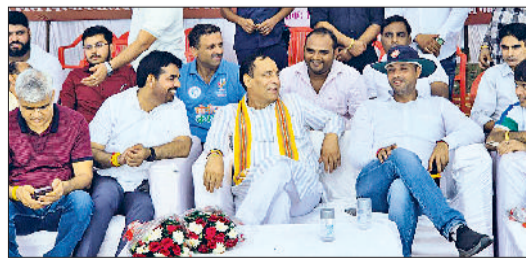
सोनीपत। टूर्नामेंट के शुभारंभ मौके पर पहुंचे भाजपा प्रदेशाध्यक्ष साथ में अन्य।