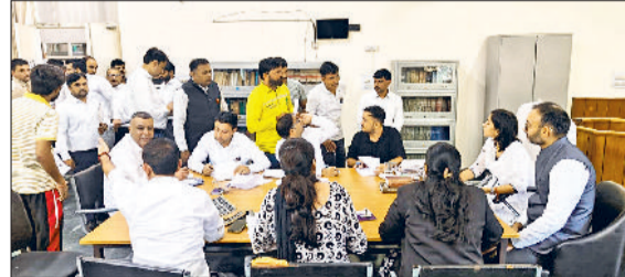
सोनीपत। लोक अदालत के दौरान मामलों का निपटारा करते न्यायधीश।

जिला न्यायालय सोनीपत सहित उपमण्डल गोहाना, गन्नौर व खरखोदा न्यायालय परिसर में शनिवार को राष्ट्रीय लोक अदालत का सफल आयोजन किया गया। यह आयोजन अतिरिक्त जिला एवं सत्र न्यायाधीश एवं जिला विधिक सेवाएं प्राधिकरण की अध्यक्ष डॉ. नरिंदर कौर के निर्देशन में हुआ। लोक अदालत की बेंचों में अतिरिक्त जिला व सत्र न्यायाधीश डॉ. नरिंदर कौर, अतिरिक्त प्रिंसिपल जज (फैमिली कोर्ट)