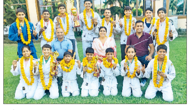
सोनीपत। विजेता खिलाड़ियों के साथ विद्यालय प्रबंधक एवं अन्य।