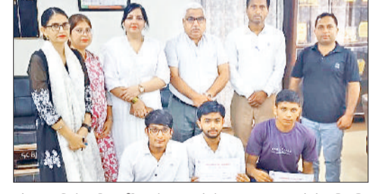
गोहाना। विजेता विद्यार्थी अपने गुरुजनों के साथ।