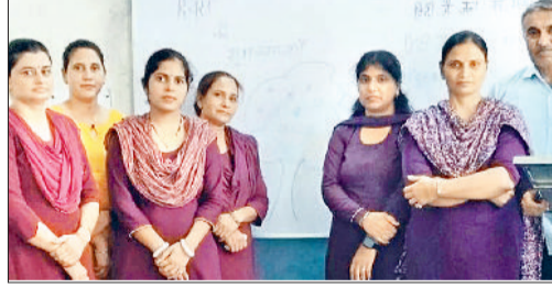
गोहाना। विद्यार्थियों को हिंदी भाषा का महत्व समझाते शिक्षकगण।