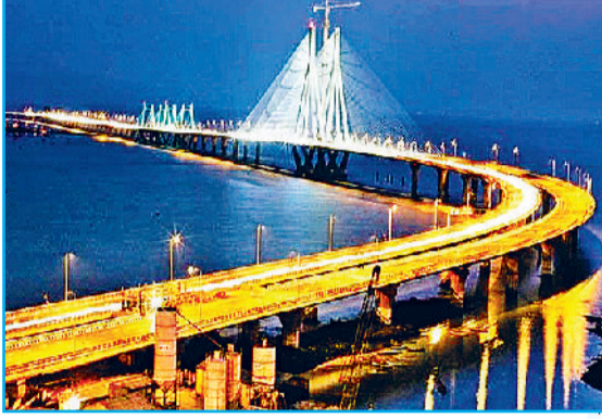
बांद्रा-वर्ली सी लिंक मुंबई में