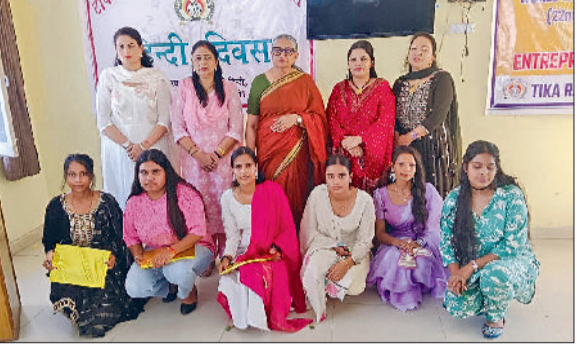
सोनीपत। विजेता विद्यार्थियों के साथ प्राचार्या एवं अन्य।