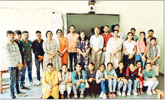
खरखौदा। प्रतियोगिता के विजेता विद्यार्थी शिक्षकों के साथ।

तथा निशु व सोनल ने संयुक्त रूप से तृतीय स्थान प्राप्त किया। नैसी व निशिता को सांत्वना पुरस्कार मिला। कॉलेज प्राचार्या व समस्त