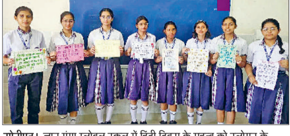
सोनीपत। ज्ञान गंगा ग्लोबल स्कूल में हिंदी दिवस के महत्व को स्लोगन के माध्यम से प्रदर्शित करती छात्राएं।