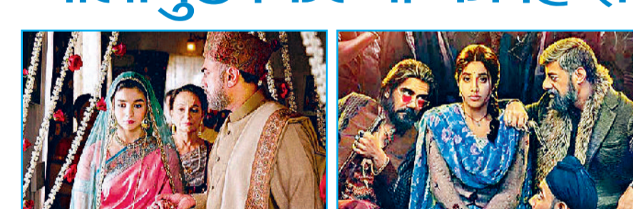
'राजी' में आलिया भूट के संवाद रहे असरदार

संवादों में लयात्मकता होती थी और इसमें कविताई का आभास होता था। समग्रता में देखा जाए तो पिछली सदी के 70 और 80 के दशक में अभिनेता हिंदी को एक खास छंद, उठराव और 'दबाव' के साथ बोलते थे। यह एक 'शास्त्रीय लहजा' था, जो दिलीप कुमार, अमिताभ बच्चन, शबाना आजमी, स्मिता पाटिल आदि कलाकारों की संवाद अदायगी में दिखता था। आज के फिल्मों की हिंदी: हर दौर की अपनी एक अलग भाषा, संवाद का एक अलग सलीका होता है। यह बात हिंदी फिल्मों पर भी लागू होती है। आज की फिल्मों की हिंदी पहले की फिल्मों से बेहतर भले न हो, यह पहले की तुलना में अलग जरूर है और असरदार भी। आज फिल्मों में बोली जाने वाली हिंदी ज्यादा लचीली, संवादधर्मी और ग्लोबल शहरी अनुभव से जुड़ी है। यह किसी खास उच्चारण और लहजे में नहीं बोली जाती बल्कि यह हमारे-आपके जैसे सामान्य लोगों की तरह ही बोली जाती है। हिंदी बोलने में दिखता है आत्मविश्वास: आज की पीढ़ी के अभिनेता और अभिनेत्रियां हिंदी को पूरे आत्मविश्वास से बोलते हैं। उदाहरण के तौर पर फिल्म 'सरदार' में बोली जाने वाली हिंदी की एक और खास बात यह है कि आज के ज्यादातर