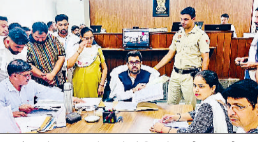
खरखौदा। लोक अदालत में मामले को निपटारे माननीय न्यायाधीश।