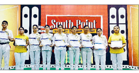
सोनीपत। प्रतियोगिता में विजेता रहे विद्यार्थी प्रमाण पत्र दिखाते हुए।