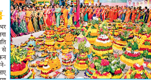
भगवान शिव-पार्वती को प्रसन्न करने के लिए यह त्योहार 1000 साल से उसी इलाके (वर्तमान तेलंगाना) में बड़ी धूमधाम से मनाया जा रहा है।

क्राब मनाया जाता है: हिंदू पंचांग के अनुसार यह पर्व श्राद्ध पक्ष, भादों की अमावस्या, जिसे महालय अमावस्या भी कहते हैं, के दिन शुरू होता है और नवरात्र की अष्टमी के दिन खत्म होता है। प्रोग्रामरियन कैलेंडर के अनुसार यह सितंबर-अक्टूबर महीने में मनाया जाता है। इस वर्ष यह पर्व 21 से 30 सितंबर तक मनाया जाएगा। यह मानसून के अंत में शुरू होकर शीत ऋतु के प्रारंभ तक मनाया जाता है। ऐसे मनाते हैं पर्व: इस पर्व में फूलों से एक बड़े पर्वत जैसी आकृति बनाई जाती है। इसके सबसे ऊपरी भाग में हल्दी से गौरम्मा बनाकर उसे रखा जाता है। इस दौरान नाच-गाने का आयोजन किया जाता है। बतकम्मा का नाम बृहदाम्मा से ही उत्पन्न हुआ है। माना जाता है कि