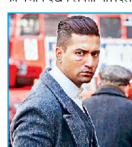
'उधम सिंह' में विक्की कौशल

अगर आप हिंदी फिल्मों के शौकीन हैं तो बॉलीवुड फिल्मों में बोली जाने वाली आज की हिंदी में पिछली सदी के पचास, साठ, सत्तर और अस्सी के दशकों की बॉलीवुड फिल्मों में बोली जाने वाली हिंदी से कुछ अंतर महसूस करते होंगे। क्या फर्क है तब और अब की फिल्मों की हिंदी में, एक दृष्टि डालते हैं। बीते दौर की बॉलीवुड फिल्मों में हिंदी: पिछली सदी के सत्तर और अस्सी के दशक के एक्टर्स की बात करें तो अमिताभ बच्चन की हिंदी बहुत समृद्ध थी, साथ ही उसमें हमशा 'संवाद अदायगी' का एक मंचोय असर दिखता था। उनसे पूर्व दिलीप कुमार के संवाद इतने अधिक अभिनय केंद्रित हुआ करते थे कि दर्शक डायलॉग्स को सुनने की बजाय देखने लगता था। दिलीप